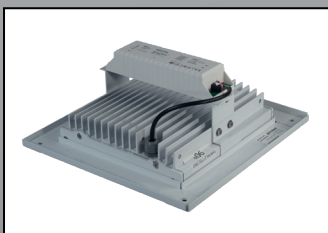
Potencia disipadora única en el mercado