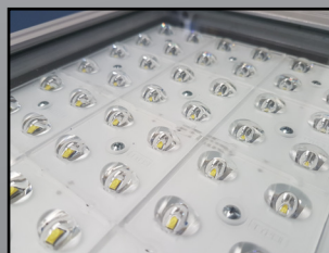
Placa LED FRIHEL, módulo intercambiable, de 36 y 64 leds